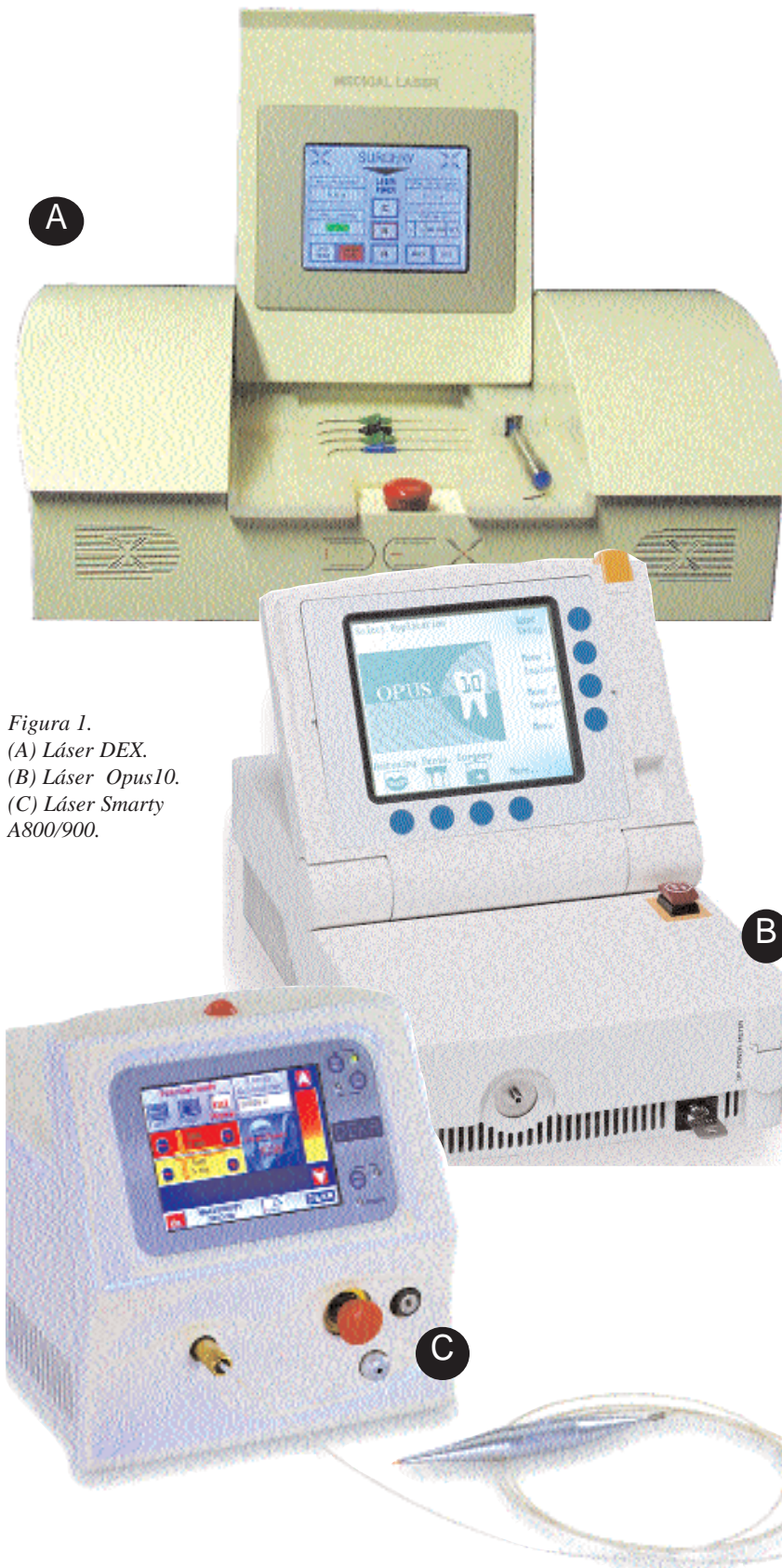
Figura 1. (A) Láser DEX. (B) Láser Opus10. (C) Láser Smarty A800/900.

El láser de diodo, debido a su pequeño tamaño y a su bajo coste económico, es actualmente uno de los láseres con más predicamento en Odontología. Las aplicaciones de este tipo de láser se relacionan con su efecto bactericida, con indicaciones específicas en Periodoncia y Endodoncia. También se utiliza en la cirugía de tejidos blandos y para el blanqueamiento dental.